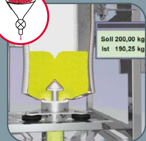
Dosieren und Teilmengenentnahme möglich