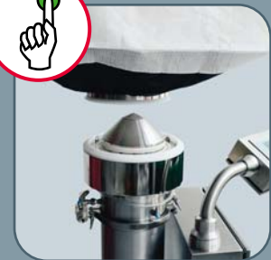
Automatisches Anschließen des SoliBags® auf Knopfdruck